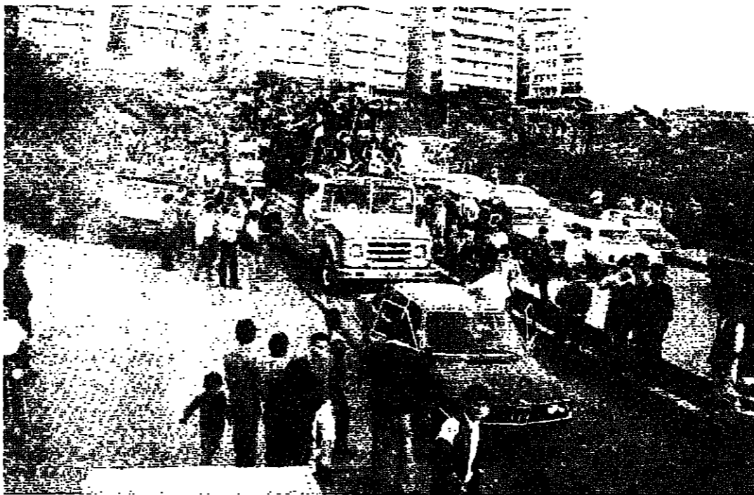
استقبال المعتقلين في الروشة